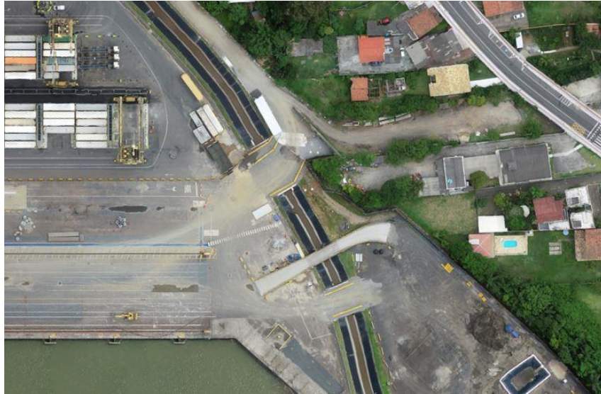
Novo acesso provisório à fase leste da obra.

Você já assistiu ao vídeo da Obra do Cais? Clique aqui.