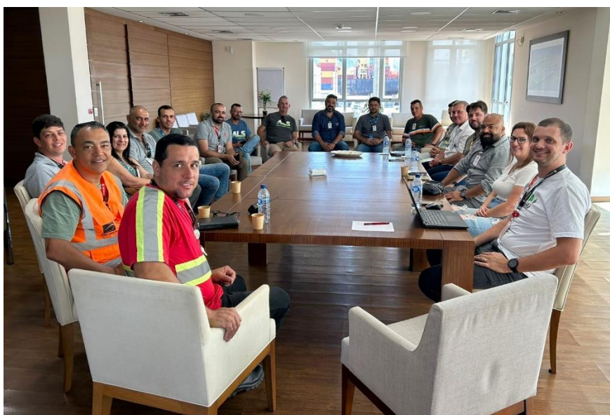
Reunião da equipe da Portonave com depots e transportadoras.