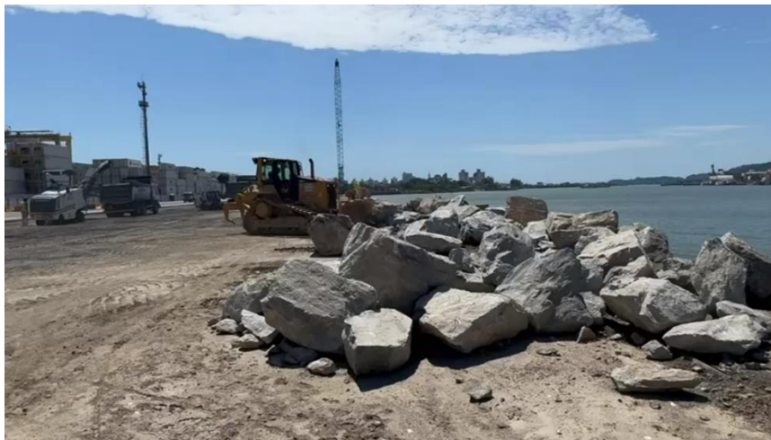
Trator de esteira empurrando rochas para o rio.

Após o início da retirada dos acessórios (defensas, cabeços, trilhos) do cais leste e a instalação de quatro boias náuticas para sinalizar a área da obra às embarcações locais, iniciou-se o processo de colocação das pedras no rio para formarem o enrocamento. O enrocamento serve como uma contenção para proteger a estrutura durante a evolução da obra e é composto por pedras estrategicamente posicionadas no rio, totalizando aproximadamente 200 mil toneladas. Após a finalização da obra, as pedras serão removidas.